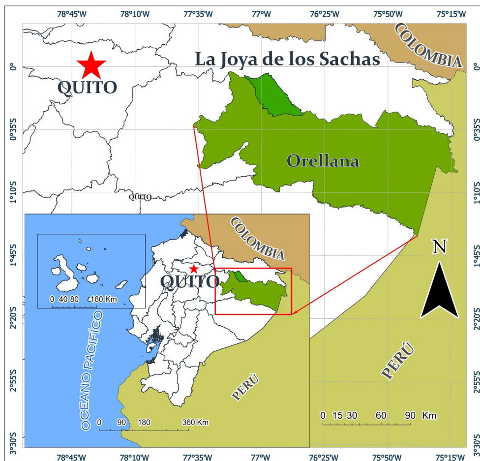
Figura 1. Ubicación geográfica del cantón La Joya de los Sachas 34 .

El estudio se desarrolló en el cantón La Joya de los Sachas, que posee una superficie de 1.200 Km 2 , ubicado al norte de la Región Amazónica Ecuatoriana (RAE) (Figura 1); limita al Norte y Este con la provincia de Sucumbios, al Oeste y Sur con el cantón Francisco de Orellana. Cuenta con una población de 67.000 habitantes 15 .