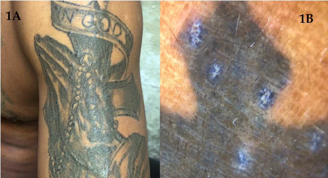
Figura 1. A: Neoformaciones papuliformes firmes sobre tatuaje de 3 a 4 mm de diámetro color negruzco sobre tatuaje tinta negra. B: Dermatoscopia con áreas blancas sin estructuras y líneas blancas a la periferia.