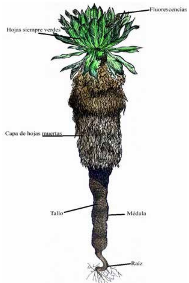
Figura 3. Dibujo de Espeletia pycnophylla y sus partes

Espeletia pycnophylla habita en el Ecuador, concentrándose mayormente en la Reserva Ecológica El Ángel que es una de las reservas más importantes país por su característica de páramo. El páramo es fundamental para la biodiversidad gracias a su participación en el ciclo del agua y su contribución a disminuir los efectos del cambio climático. De esta región es endémica la subespecie Espeletia pycnophylla subsp. Angelensis . Se pudo ver que, al ser parte del género Espeletia, susp. angelensis ha logrado adaptarse de manera impresionante a los ambientes extremos del páramo, a través de técnicas como reclutamiento de semillas, sobre enfriamiento y yema nocturna. Estudios demuestran que esta subespecie es única con respecto al crecimiento en función de la gradiente altitudinal y que es el hogar de varios macro artrópodos