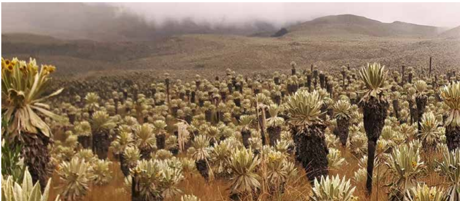
Figura 2. Espeletia pycnophylla ssp. angelensis Cuatrec. (Asteraceae)